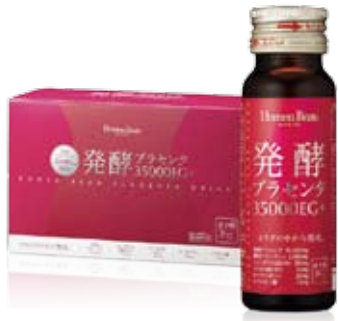
発酵プラセンタ35000EG+ 〈50mL×10本〉 5,616円 (税込)