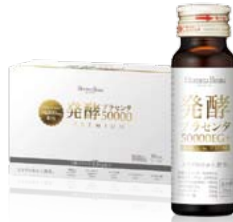
発酵プラセンタ 50000 プレミアム 〈50mL×10本〉 5,616円 (税込)